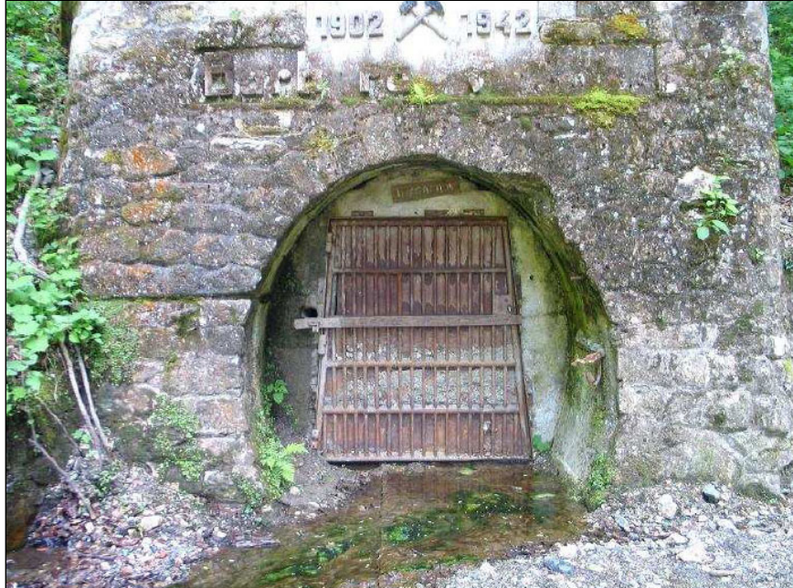
Huda jama Barbarin rov 12-05-2006.g.

blokade kod zaselka Košnjice malo prije Celja. Izbjeglička kolona civila kretala se na vozovima upregnuta konjima i pješice. Vozila i konje su partizani uzeli a sve ljudi su pobili. Nitko nije preživio taj masovni pokolj.