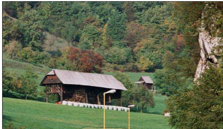
Brnica, „Pustov kozolec“ 12-10-2003.g. (gore u brdu Jelenca više šahtova-grobišta)

Veliki dio hrvatskih izbjeglica je bio na livadi iznad Brnice (kod Hrastnika) gdje je bilo nekoliko hiljada ljudi. Te ljudi počeli su ubijati 13. svibnja. Vodili su ih po grupama po 500 ili više prema „Pustovem kozolcu“ (škednju) u zaselku Brnica. Tu su morali odložiti stvari i skinuti se. Vodili su ih u šumu na brdu udaljeno oko 800m, gdje su ih sve pobili i bacali u rudarske jame, koje se još danas mogu vidjeti. Koliko je žrtava u tim rudarskim jamama neće se nikada saznati. Govori se da bi moglo biti 4-5 tisuća slovenskih domobrana. Te ljudi su kod „Pustovog kozolca“ sve skinuli i vezali ih. Društvo je postavilo križ i obnovilo kapelu. Grobišta su oko 100m iza kapele.