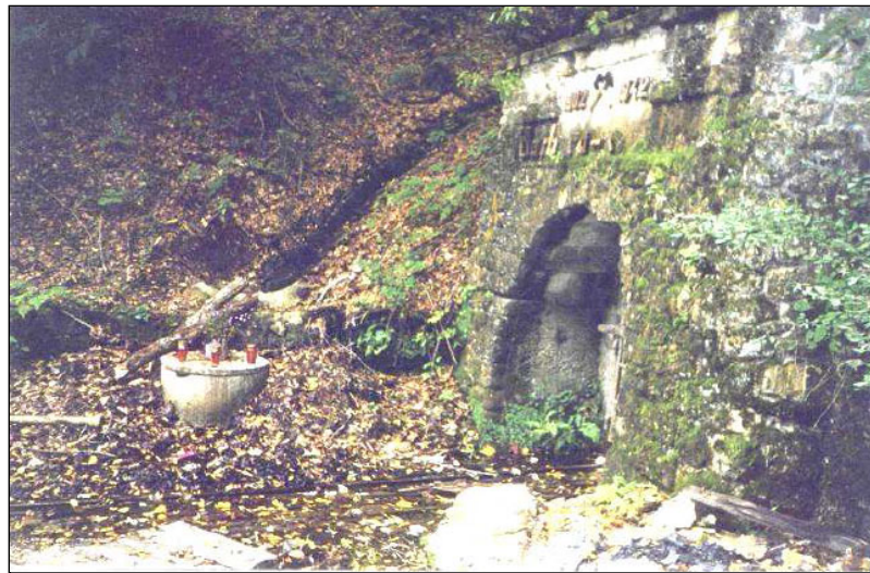
Barbarin rov 07-09-1997.g. (te godine postavljena i kapela „Sv.Barbara“) Da, ovako izgleda spomenik komunističkih krvososa!

Zasavske gore se protežu sjeverno od rijeke Save u kvadratu od Zagorja, Trbovlja, Hrastnika, Laškog pa sve do celjske padine. U Zborniku „Tudi smo umrli za domovina“, koji je preveden iz slovenskog na talijanski jezik pod nazivom „Anche noi siano mort per la Patreia“, izdana 2000.g. gdje su opisana grobišta nastala poslije drugog rata za to područje. Popisano je 29 grobišta.