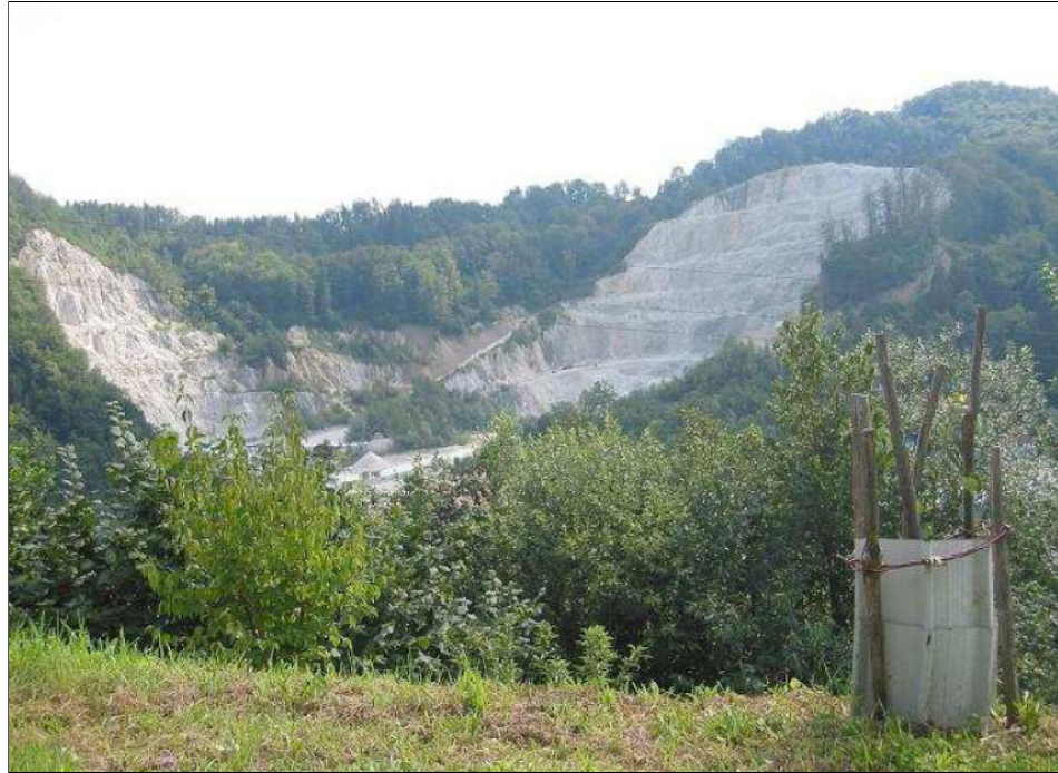
Kamenolom u Spodnjoj Rečici na putu od Laškog do Hude jame, 17-08-2004. g.